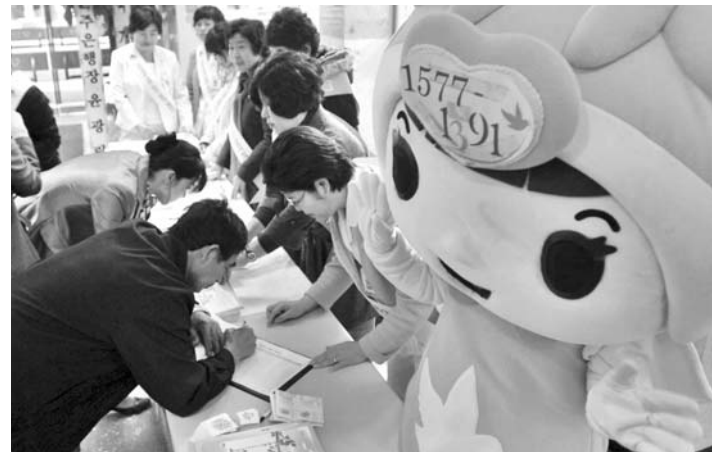
“아동학대 이제 그만~” 제주특별자치도 아동보호전문기관과 제주도간호사회가 11월

연도별 의료수가 인상률은 2004년 2.65%, 2005년 2.99%, 2006년 3.50%, 지난해 2.30%, 올해 1.94%다.