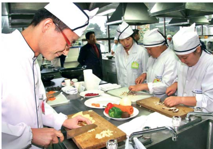
△11월 21일 제주한라대학에서 열린 제5회 지적장애인 요리대회에서 참가자들이 감자와 버섯 등 요리재료를 손질하고 있다.

의 집과 한림소망의집 장애인 주간보호시설이 각각 은상과 동상을 수상했다. 이들 팀에는 각각 트로피와 부상이 수여됐다.