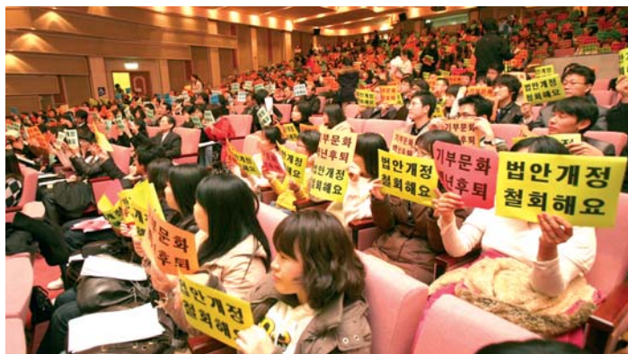
△11월 27일 국회 의원회관에서 열린 '공동모금회법 개정 저지를 위한 범사회복지계 결의대회'에서 참석자들이 '기부문화 백년후퇴' '법안개정 철회'라고 쓰여진 피켓을 들고 있다.

공동모금회는 11월 20일 성명을 내고 "정부의 기부문화 주도는 시대착오적 발상"이라며 "민간기부문화 발전을 저해하는 사회복지공동모금회법 개정을 철회하라"고 밝혔다.