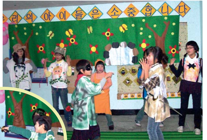
△제일지역아동센터 어린이들이 영어 뮤지컬 ‘피터 팬’을 공연하고 있다.