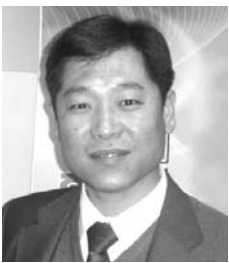
문 창 인