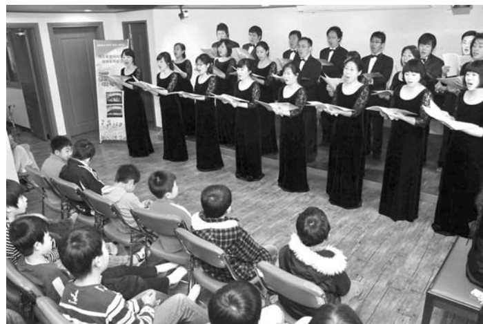
“희망 나눔 음악회” 제주특별자치도립 서귀포예술단이 마련한 2009 문화소외지역을 위한 희망 나눔 음악회가 2월 24일 천사어린이집에서 열려 서귀포합창단이 아름다운 선율로 원생들에게 노래를 선사하고 있다.

또 "평가방법이 어렵지 않으므로 행정부담이 적고 인센티브만 제공하므로 불리한 점도 없으며, 무엇보다 스스로를 평가해 서비스를 향상할 수 있는 기회가 될 수 있으므로 현재 시설이 열악한 경우에도 참여를 꺼릴 이유는 없다"고 설명했다.