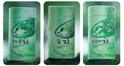
△제주구지뽕차, 제주속차, 제주조릿대차