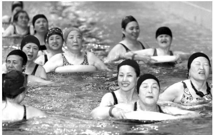
“물속에선 장애가 없어요” 한국시각장애인연합회 제주도 지부가 마련한 ‘중증 시각장애인 수중재활교실’에 참가한 장애인들이 5월 20일 제주종합경기장 실내수영장에서 자원봉사자들과 함께 아쿠아로빅을 즐기고 있다.

한편 제주도는 민생안정지원단을 구성·운영해 올해 초 실태조사를 벌여 경제적으로 어려움을 겪고 있는 저소득층에 긴급복지지원, 기초생활수급자 신규 책정, 사회서비스일자리 제공, 민간지원 연계 등을 통해 9138가구에 20억7400만원을 지원했다.