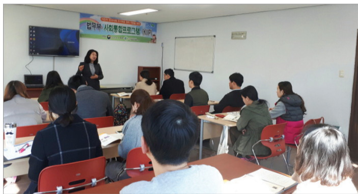
▲ 지난달 14일, 은성종합복지관 '사회통합프로그램' 교육 모습.

당사자를 도내 최초 정규직 사회복지사로 채용하며 다양한 이민자(다문화가족) 특화사업 프로그램을 지원하고 있다.