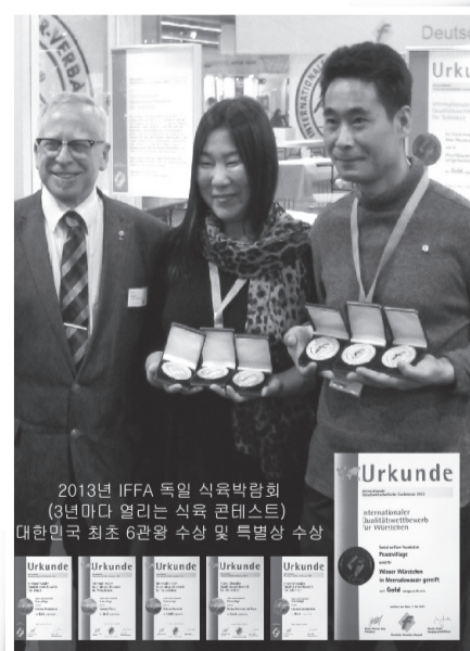
▲ 2013년도 독일 프랑크푸르트에서 열린 국제육가공박람회(IFFA)에서 '평화의마을' 소시지가 6개 부분 금상을 수상했다.

여 2007년 제주지역 소시지·햄 생산업체 중에서는 처음으로 HACCP 인증을 받게 된다. 이러한 노력의 결실로 롯데마트에 입점을 하게 되지만 고가의 재료비 등으로 늘 적자를 면치 못하다 결국 1년 2개월 만의 철수를 하게 된다. 이런 값진 경험들은 평화의 마을 가족들에게 큰 사업 밑천이 되었고 드디어 2013년 독일 프랑크푸르트에서 개최된 국제육가공박람회(IFFA)에 출품된 제품 8개 중 6개가 금상을 수상하는 쾌거를 거두게 된다.